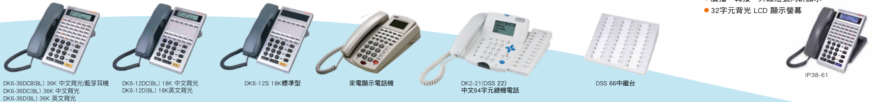
DK6-36DCB(BL) 36K 中文背光/藍芽耳機 DK6-36DC(BL) 36K 中文背光 DK6-36D(BL) 36K 英文背光